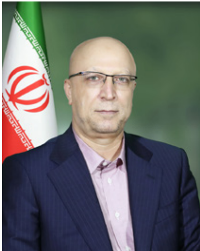
دکتر محمد علی زلفی گل وزیر علوم، تحقیقات و فناوری